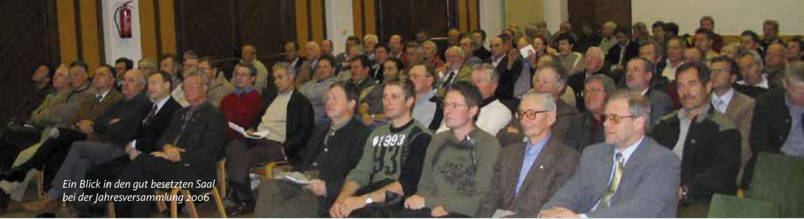
Ein Blick in den gut besetzten Saal bei der Jahresversammlung 2006