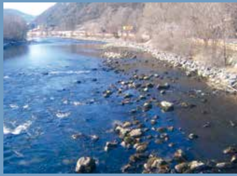
Der Eisack bei Brixen am Freitag um 9 Uhr und am Samstag um 9 Uhr: deutlich ist der Schwallbetrieb sichtbar.