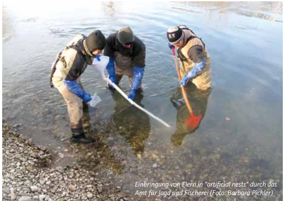
Einbringung von Eiern in "artificial nests" durch das Amt für Jagd und Fischerei

2010 wurde im wissenschaftlichen Beirat ein Projekt genehmigt, welches die Sicherung und Verbesserung unserer Seesaiblingsbestände in den Hochgebirgsseen zum Ziel hat. Dazu hat die Landesfischzucht auch in diesem Jahr zusammen mit den Bewirtschaftern Wildfänge der Seesaiblinge in Gebirgsseen durchgeführt. Anschließend werden die einzelnen Seesaiblingspopulationen genetisch charakterisiert und in der Fischzucht vermehrt. Dadurch soll es möglich sein, Seen möglichst schonend und mit geeignetem Material zu besetzen, anstatt auf Fremdmaterial zurückgreifen zu müssen. Diese Fischarten, wie z.B. der Elsässer Saibling werden oft viel zu groß in die Seen eingebracht. Die natürlichen Populationen in den untersuchten Seen liegen zwischen 12 und 22 cm Totallänge. Diese Zwergform, auch Schwarzreuter genannt, lässt sich auf die kurze Wachstumsphase in den Ge-