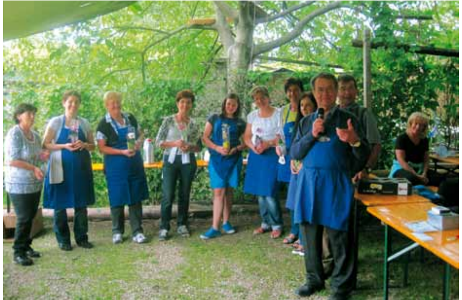
Danke den Mithelfenden Frauen!

Am Sonntag, dem 20. Mai 2012 wurde zum 30. Mal am Kalterer See das traditionelle Freundschaftsfischen des Fischereivereines Kaltern ausgetragen. Auch der „Wettergott“ meinte es gut und zauberte ein Traumwetter für die zahlreichen Jungfischer und Fischerinnen. Bereits um 5.30 Uhr machten sie sich bereit, um mit ihren Booten an die Erfolgsversprechenden Plätze zu rudern und ihre Köder auszulegen. Die Petri-Jünger brauchten nicht lange zu warten, denn schon nach kurzer Zeit konnten schon Fische gefangen werden. Nach einem gemütlichen und freundschaftlichen Zusammensein bei gegrilltem Fisch und Fleisch, ein Glas Wein und harten Kartenspiel wurde das 30. Freundschaftsfischen am Kalterer See beendet. Dankeschön an alle Teilnehmer und Teilnehmerinnen die am Freundschaftsfischen teilgenommen haben. Weiters möchte ich mich auch bei mei-