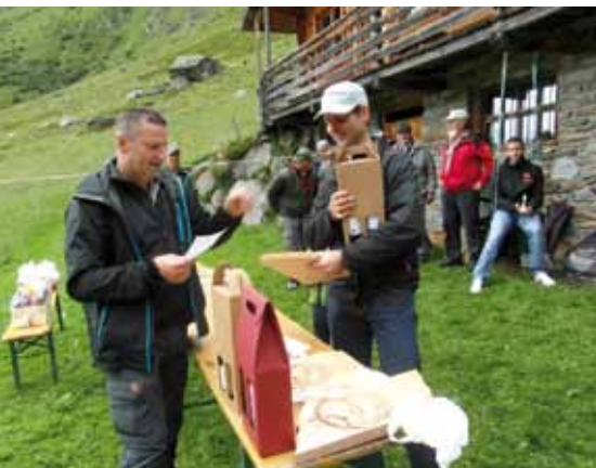
3. Platz Preisfischen

Es gibt 3 Seefeldseen, der erste und große Seefeldsee liegt 2370 m über den Meer, und hat einer Größe von 6,8 ha. Vom ersten Seefeldsee über die Seefeldalm erreicht man in ca. 30 min. den zweiten Seefeldsee. Dieser See ist etwas kleiner als der erste See und liegt auf 2.500 m über dem Meer. Zum dritten und kleinen Seefeldsee ist es nur mehr Hundert Meter. Vom Norden her ist die Seefeldalm mit dem höchsten Berg dieser Alm den Seefeldspitz 2.767m abgeschirmt. Der Seefeldspitz ist ein Grasberg also leicht zu besteigen und bietet einen Atemberaubenden 360° Rundblick.