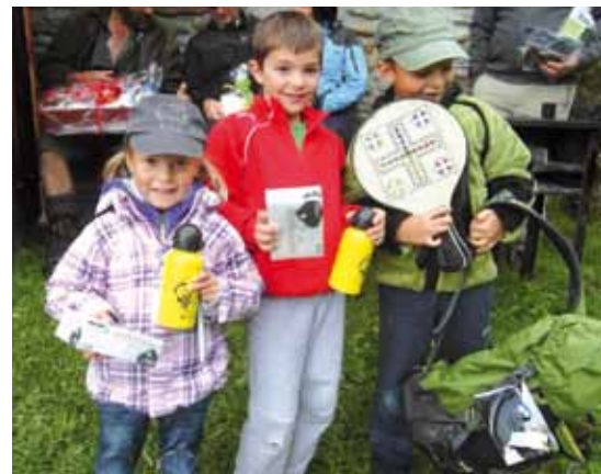
Preise für die Jungfischer

Ab Meransen den Parkplatz Altfasstal direkt anfahren (Parkplatz Gebührenpflichtig 3,00 € pro Tag) und dann den Wegweiser 14/15 folgend erreicht man durchs Altfasstal wandernd in 2,5 Std den 1. Seefeldsee und in ca. 3,5 Std den Seefeldspitz 2767m.