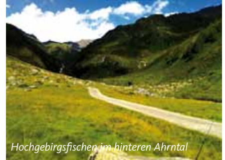
Hochgebirgsfischen im hinteren Ahrntal