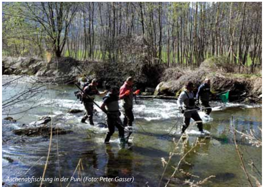
Äschenabfischung in der Puni