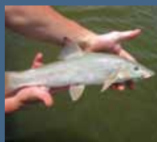
> Projekt ABaTe

Mitteilungsblatt des Landesfischereiverbandes Südtirol