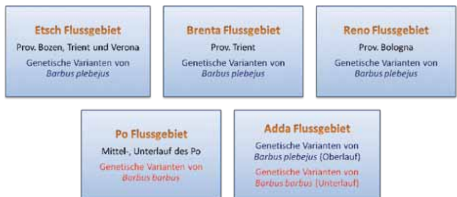
Zusammenfassung der Ergebnisse der mitochondrialen DNA-Sequenzuntersuchungen (Cytochrom- b Gen) von Barbenproben aus dem Nördlichen Adriaeinzugsgebiet.

Conservation Genetics Group, Department of Biodiversity and Molecular Ecology, Research and Innovation Centre, E. Mach Foundation