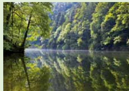
Fische sollen sich im Doubs wieder wohlfühlen können.

Vorgesehen ist ferner ein neues gemeinsames Wasserreglement für die rund 75 Kilometer lange Grenzstrecke des Doubs. Aktuell ist rein Reglement von 1969 die Basis des heutigen Betriebs.