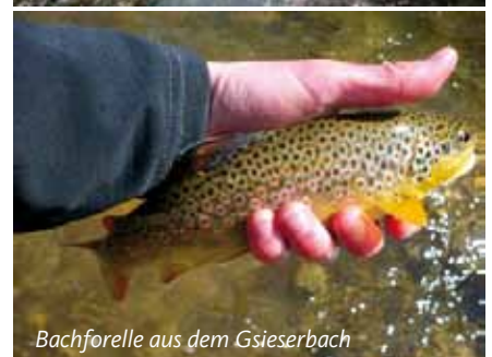
Bachforelle aus dem Gsieserbach