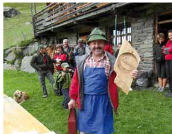
Sieger Preisfischen und der Organisator