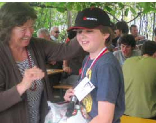
Preisübergabe an den Jungfischern durch die Bürgermeisterin Gertrud Benin