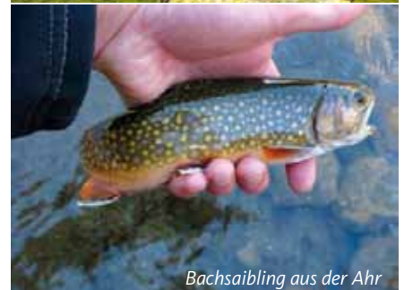
Bachsaibling aus der Ahr