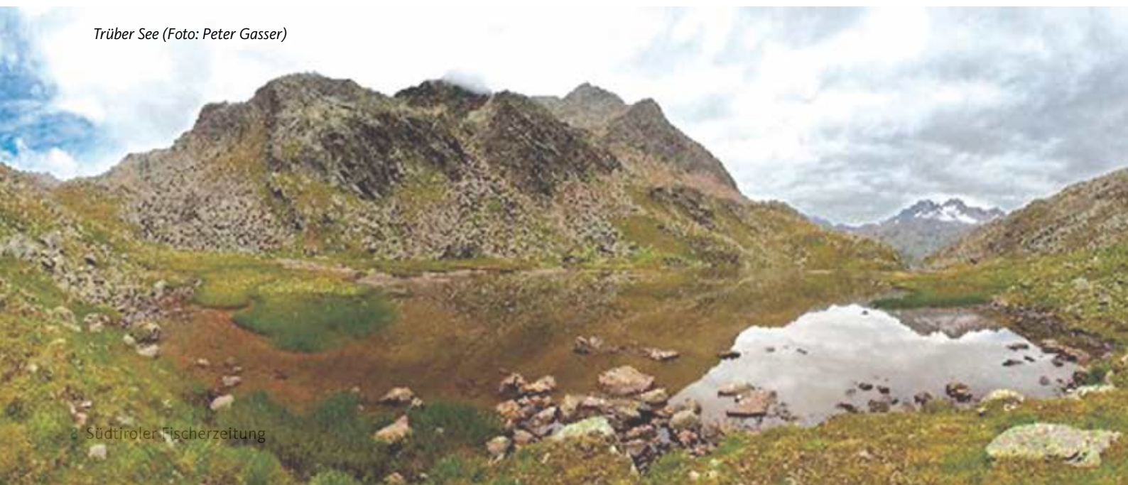
Trüber See

ob das jeweilige Gewässer für einen solchen Besatz überhaupt geeignet ist und ob der Besatz zum richtigen Zeitpunkt durchgeführt wurde. Dazu wurde vom Landesfischereiverband in Zusammenarbeit mit dem Naturmuseum ein Vortrag von Dipl.-Ing. Georg Holzer organisiert, der seine langjährige Erfahrung mit dem Eibesatz und mit Besatz im Allgemeinen