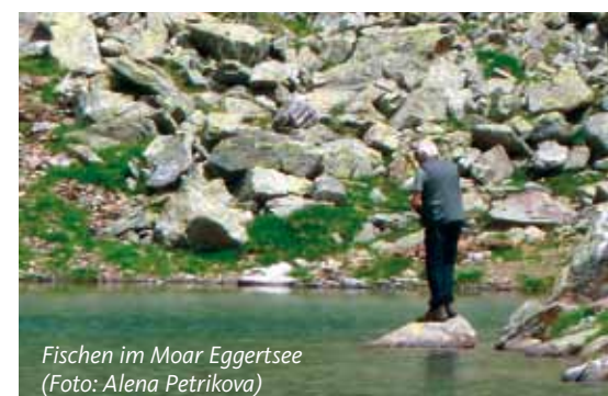
Fischen im Moar Eggertsee