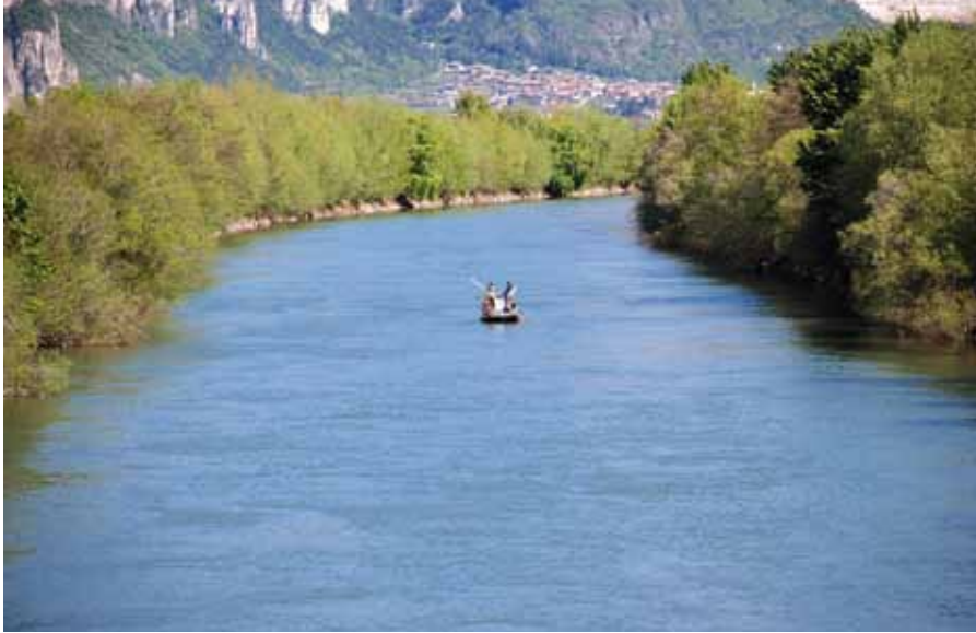
Beprobung der Barbe mittels Bootsbefischung in der Etsch.

( B. plebejus und B. caninus ) zunehmend schwinden. So wird beispielsweise in einer fischbiologischen Abhandlung zum Thema Po aus dem Jahr 1982 von Giovanni Delmastro („I pesci del bacino del Po“) die fremde Barbenart überhaupt nicht angeführt, während ein aktueller Fischatlas der „Autorità di Bacino“ aus dem Jahr 2008 für den Mittel- und Unterlauf des Po-Gebietes ausschließlich die nicht-heimische Art angibt. Heimische Barben sollen in diesem Gebiet praktisch bereits verloren gegangen sein. Eine ähnliche Situation muss auch für andere Flussgebiete der Nordadria befürchtet werden. Allerdings sind morphologische Kriterien zur Bestimmung der verschiedenen Arten nicht immer eindeutig und ausführliche genetische Datensätze fehlen bislang weitgehend. Es kann als wahrscheinlich angenommen werden, dass die fremde Barbe durch „gemischten Weißfischbesatz“ für die Angelfischerei die Flüsse der Nordadria erobern konnten.