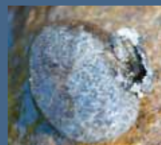
> Die Köcherfliege (Trichoptera)