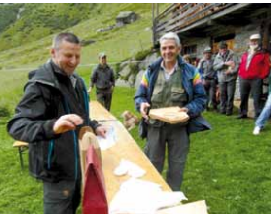
2. Platz Preisfischen